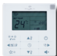
KCT-02.1 SR vaste bediening (optioneel)